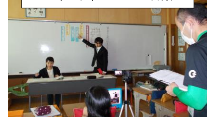
家庭学習補充のためのビデオ撮影を試みる6年担任