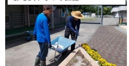
きれいな花々で子どもたちを迎えようと花壇の整備をする職員